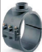
6 tornillos de \varnothing 140 a \varnothing 200mm.