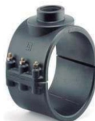
6 tornillos de \varnothing 140 a \varnothing 200 mm.