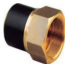
ADAPTADOR PE/LATÓN ROSCA HEMBRA